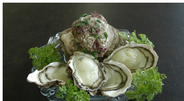
にかほ市名産 岩牡蠣（今が旬、生が美味しい。）

*3月8日より出力制限運転で定格出力 1,000 kW となっていますが、設備利用率は 1,990 kW として算出しています