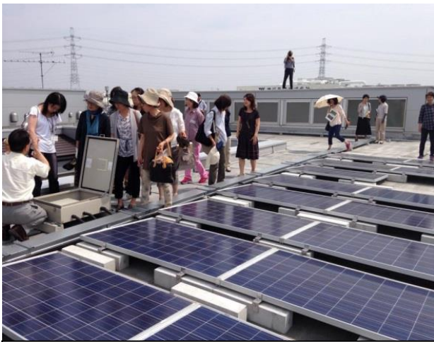
屋根のパネルを見学する参加者（45名参加）