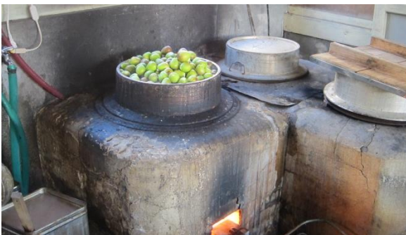
②大きな和窯で茹で洗い。