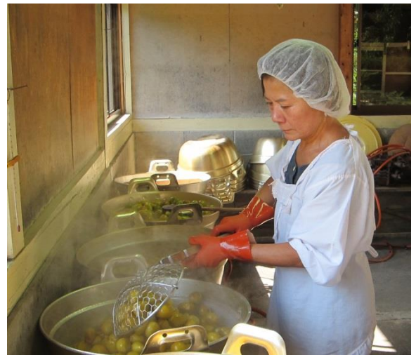
③砂糖と水あめを使って、6時間以上、丁寧に煮込みます。