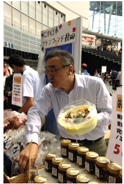
秋田県にかほ市から埼玉まで車で往復された皆さん、大変お疲れ様でした。