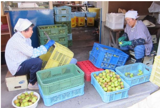
①新鮮ないちじくのへたを取る。

甘露煮づくりは毎年9月下旬から10月末ぐらいまでと時期が短いので、実際に加工しているところを見させていただくのは初めてです。