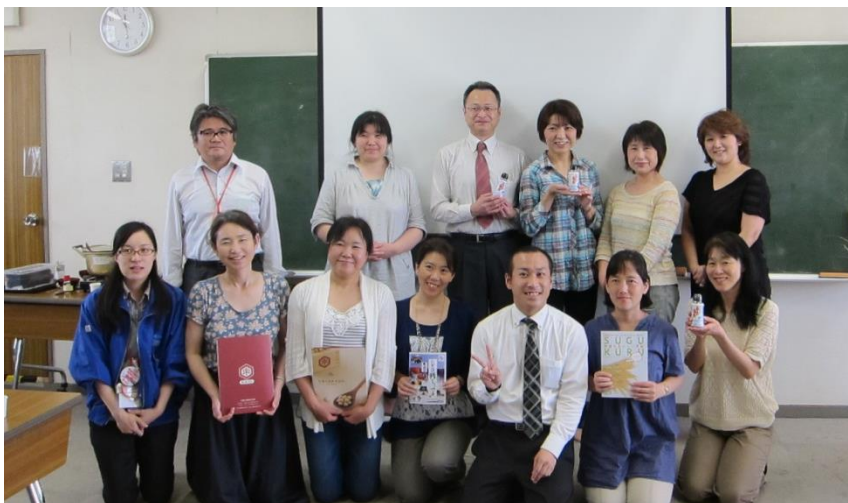
写真： 開発チーム（環境委員会） の皆さん

学習に引き続き、試食を行いました。組合員のメンバーからは、こんな料理、あんな料理に合いそうとか、アレルギーのあるお子さんに醤油の代わりに使えないか、など様々なアイデアが飛び出しました。今後、夢風ブランド企画として、開発の検討をすすめていきます。