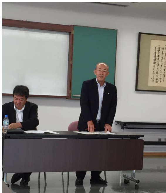
<写真：須田正彦にかほ市副市長>

7月8日、にかほ市役所象潟庁舎にて、2015年度連携推進協議会総会を開催しました。