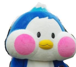
にかほ市公認 キャラクター にかほっぺん