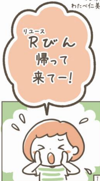
機関紙コルザ 2019年9月号より