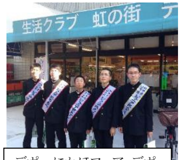
デポーにかほフェア:デポー浦安でにかほ市の中学生がにかほ市をアピール。