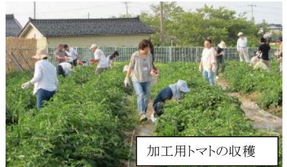
加工用トマトの収穫