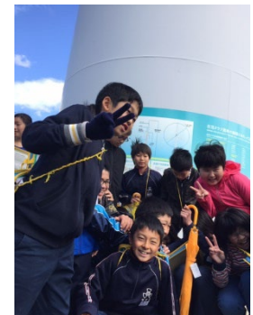
平沢小6年生が見学