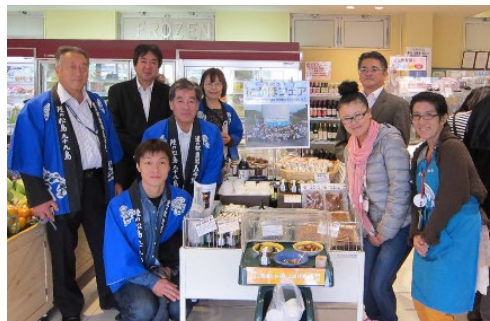
デポーにかほフェア:デポー園生でにかほの特産品をアピール