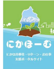
移住定住ポータルサイト