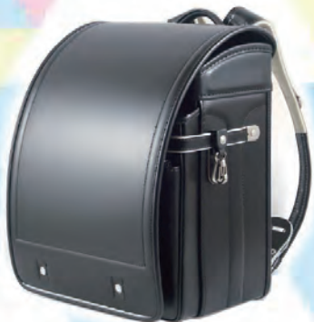
馬革・コードバン

アフリカとアフガニスタンのドライフルーツ、定番（マンゴーなど）から珍しいもの（ドライメロンなど）までいろいろな種類を用意します。