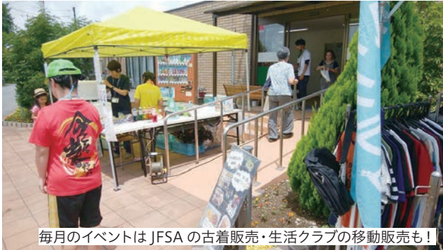
毎月のイベントはJFSAの古着販売・生活クラブの移動販売も！