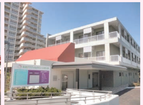
写真左：生活クラブいなげビレッジ虹と風 生活棟 右：同 福祉棟