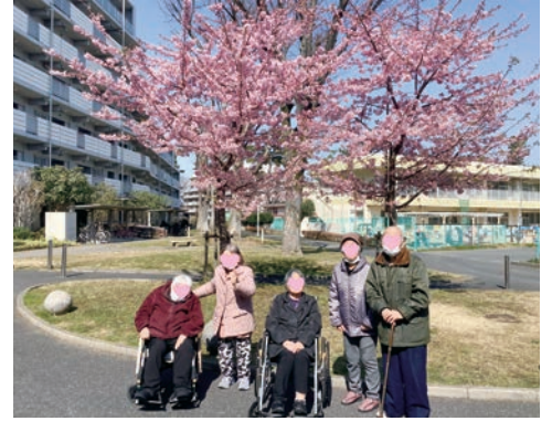
早咲きの桜を見て春を満喫