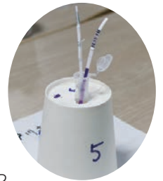
↑ 検体を容器内でつぶし、試験紙を投入。陽性だとRR・LLの試験紙に線が出る