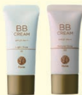
01 ライトオークル 02 ナチュラルオークル

美容液・クリーム・下地・日焼け止め・コンシーラー・ファンデーションがこの1本で完結します。色は2色で02が標準色です。薄付きでナチュラルメイクに仕上がりますが、シミやソバカスなどはしっかりカバーします!