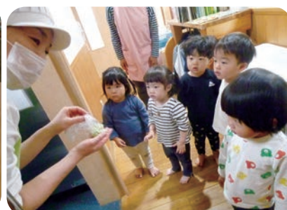
えんどう豆の収穫から給食まで：写真左から、えんどう豆の収穫→さやから豆を出す→給食に入れてね♡