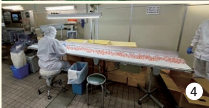
① 型取りのためのコーンスターチと木枠 ② ゼリーの型。①に押しつけて凹型をつくりそこにゼリーの果汁を流し込む ③ できあがったゼリー ④ 3段階の検品をしているところ *エアータック：圧縮した空気ですゼリー以外のごみを飛ばし見やすくして検品する。

生産者の努力がたくさん詰まっている消費材をこれからも「食べ続けていく！」という思いがこみ上げてきました。