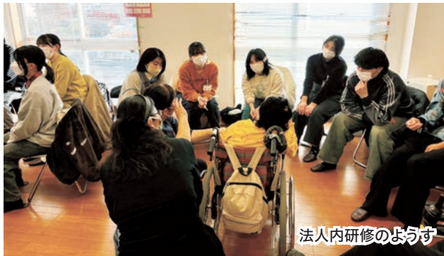
法人内研修のようす