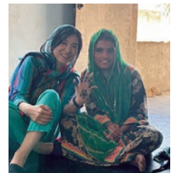
将来の夢はアーティストという生徒にヘナタトゥーをしてもらいました