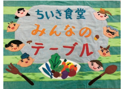
ボランティアさん作成のタペストリー。地域食堂開催時に入口に掲げられる

自分で食事の盛付・キッチンまでの食器の片付け等、いろいろなスタイルでの積極的な参加をお願いしているので、会話が增え、それぞれのかかわりが深くなり、地域食堂がきっかけのお友だちができるほどになっています。