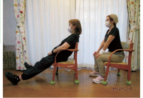
左：正しくない座り方 右：正しい座り方

ずれ防止・呼吸・消化機能の改善・バランス感覚の維持などの効果も期待できるからです。